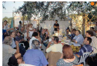
La Guinguette des paroles