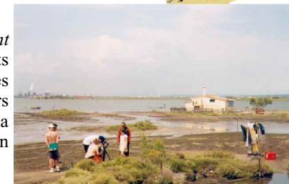
Tournage de "Nulle part" - Envies Rhôneements 2002

Les Envies Rhôneements ont également inscrit le nomadisme territorial au cœur de leur démarche : en effet, l'itinérance permet à la fois de révéler les particularismes de chaque lieu et d'être porteur d'une identité territoriale plus large, celle du delta du Rhône. Cette forme permet également de développer des nœuds de relations riches et complexes entre artistes, gestionnaires de l'environnement, équipes des sites, habitants, touristes, au travers d'une programmation spécifiquement construite pour chaque lieu.