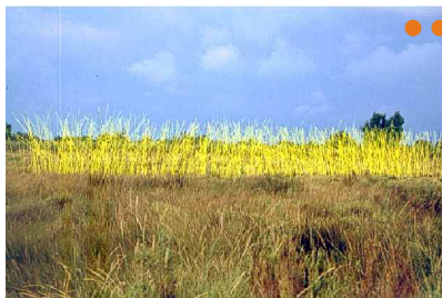
Les phasmes - Cie Lola Muanace - Envies Rhôneements 2003

Depuis sa création en 1999, ce projet questionne notre rapport à l'environnement en s'articulant sur différents temps et différentes thématiques.