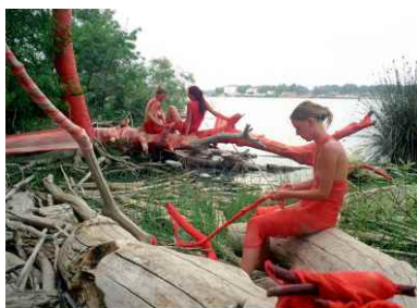
Ilotopie : relier le mort et le vivant

le temps des créations in situ propose à un artiste ou à un collectif d'artistes de s'imprégner d'un bout de territoire pour en offrir sa propre vision.