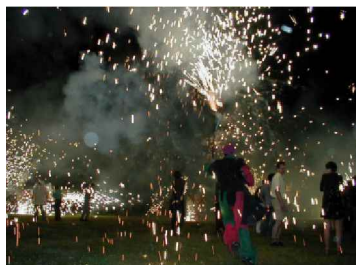
Les diables de l'Onyar - Envies Rhôneements 2002

des temps conviviaux et festifs autour d'une programmation artistique inventive proposent des œuvres mettant en scène la relation homme/nature, des spectacles pour révéler l'esprit des lieux, des installations à rêver, du cinéma sur écran d'eau, des concertos pour les marais, des plein air pour regarder