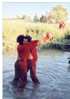
Espèce en voie de disparition - Cie Ex Nilho - Envies Rhôneements 2003

Les Envies Rhôneements ont également inscrit le nomadisme territorial au cœur de leur démarche : en effet, l'itinérance permet à la fois de révéler les particularismes de chaque lieu et d'être porteur d'une identité territoriale plus large, celle du delta du Rhône. Cette forme permet également de développer des nœuds de relations riches et complexes entre artistes, gestionnaires de l'environnement, équipes des sites, habitants, touristes, au travers d'une programmation spécifiquement construite pour chaque lieu.