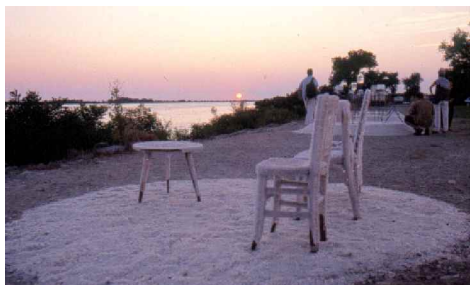
Installations en sel - Cie Ilotopie - Envies Rhôneements 2001

Un festival où les regards se croisent entre art, environnement, nature et culture, où la création artistique s'inscrit dans des lieux qui ne sont pas dédiés à la représentation, et où émergent et vibrent les multiples identités de cette terre, traversée de vent, de sel, d'eau et d'humanité métissée.