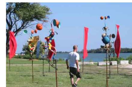
Les éléosiciens - Envies Rhôneements 2002